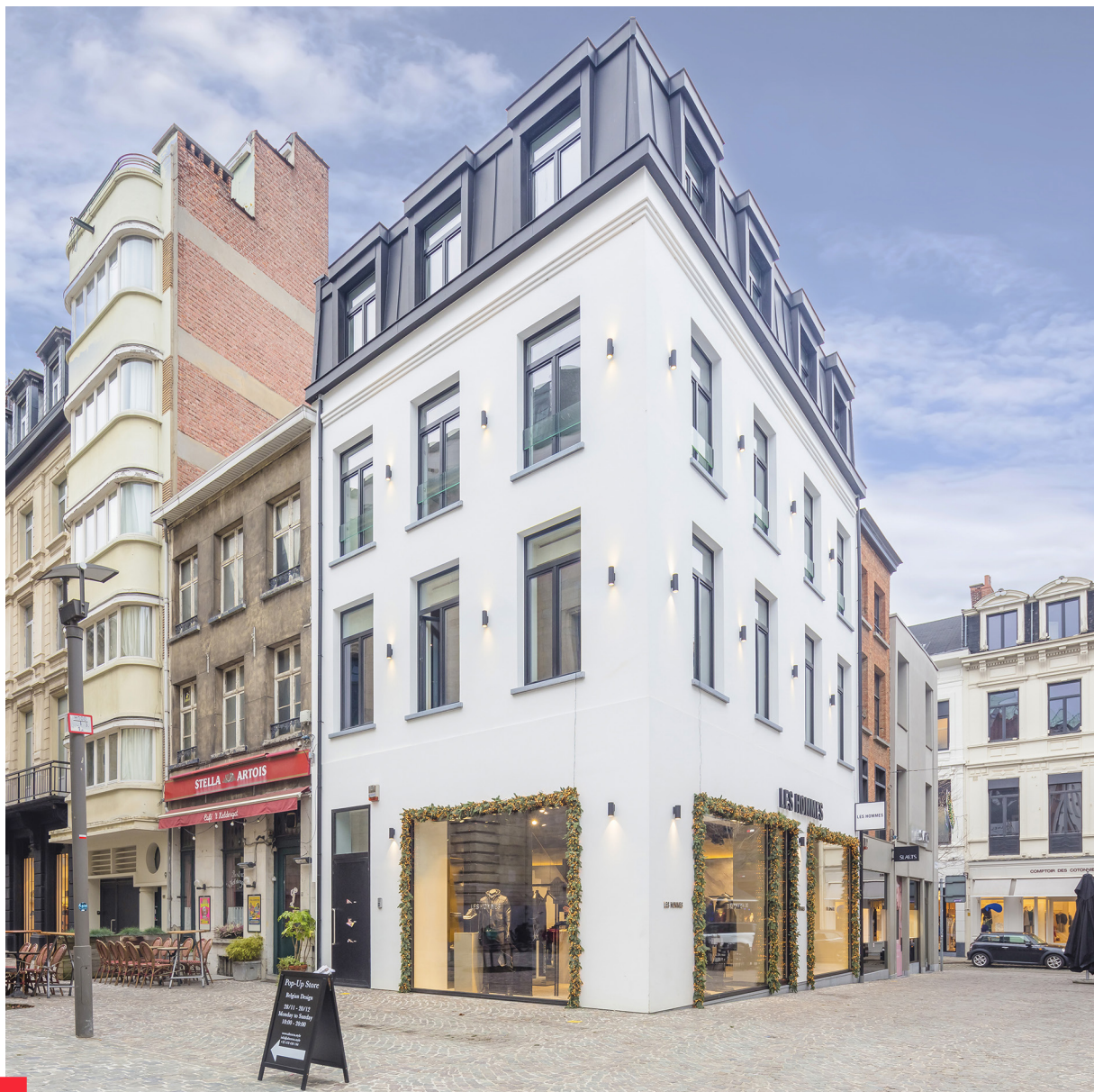
Anvers - Armeuveelstraat - Les Hommes

VASTNED RETAIL BELGIUM SA, société immobilière réglementée publique de droit belge, Taco de Groot, Rudi Taelmans ou Reinier Walta, tél. + 32 3 361 05 90, www.vastned.be