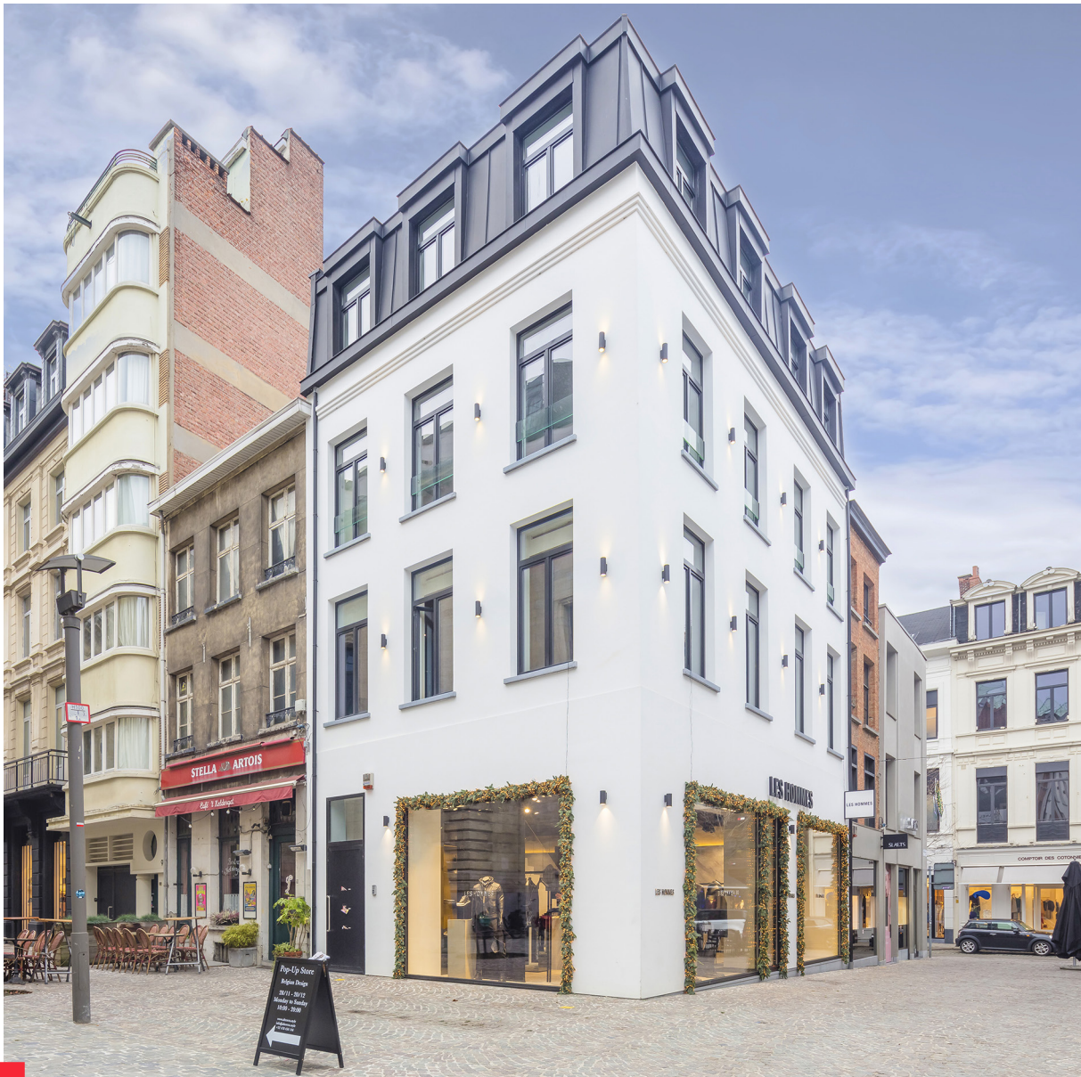
Antwerpen - Armeuveelstraat - Les Hommes